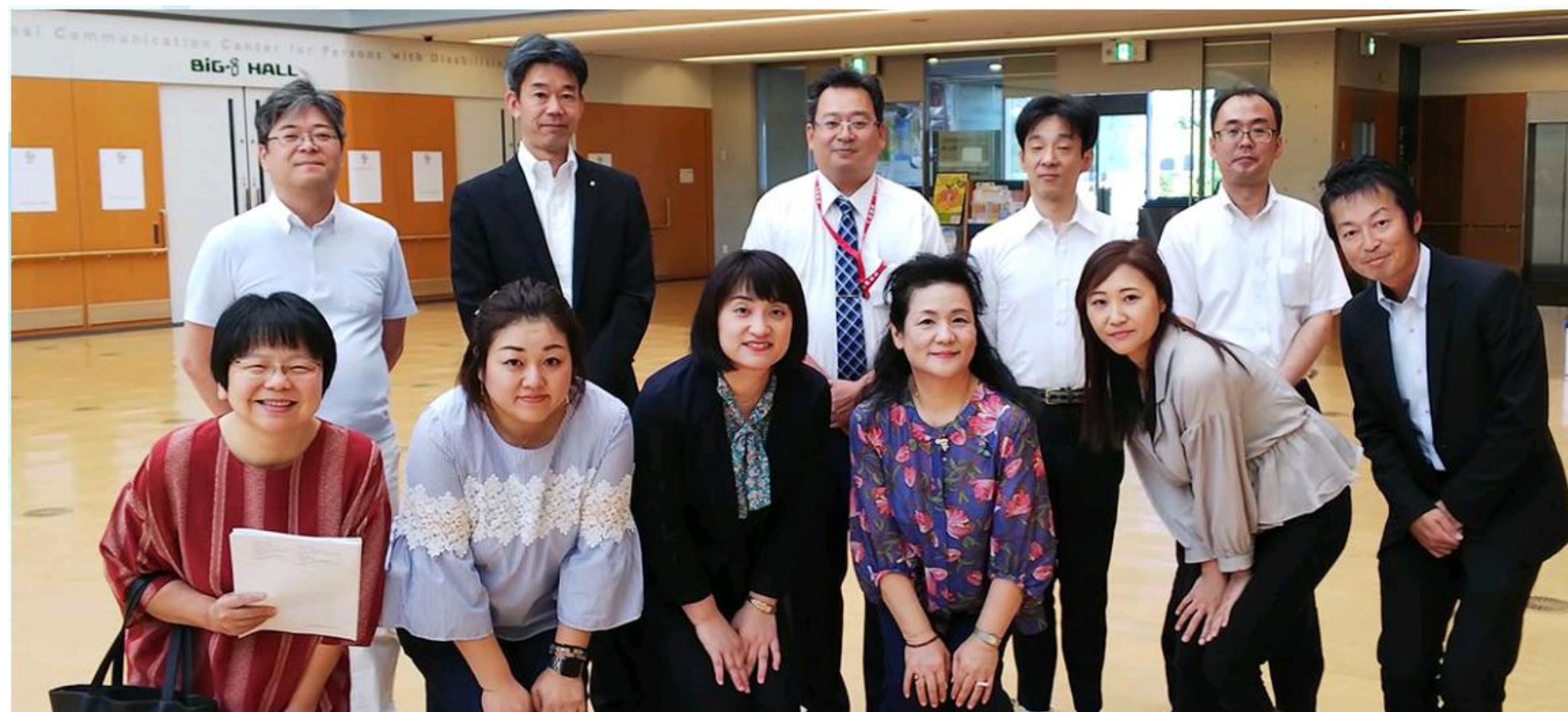
【堺ブロック資質向上(法定外)研修】